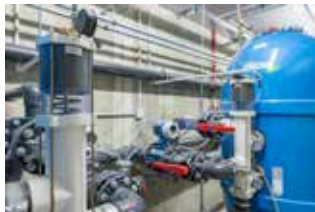
Unmittelbar am Becken im Untergeschoss ist die Ospa-Technik installiert.

Unmittelbar an der Beckenlängsseite im Untergeschoss wurde ein 3 m breiter Technikgang geschaffen, in dem die Ospa-Schwimmbadtechnik installiert ist. Dem Standard für Hotelbäder entsprechend ist die Ospa-Technik nach DIN ausgelegt und beinhaltet zwei 1000er Filteranlagen, die Desinfektionstechnik BlueClear, Dosiertechnik für pH-Heben und -Senken, den Schaltschrank sowie die Ospa-Steuerung BlueControl. Am Display können alle Wasserwerte kontrolliert und bei Bedarf korrigiert werden. Beheizt wird das Schwimmbecken über ein Blockheizkraftwerk, das im Zuge der Neubaumaßnahmen ebenfalls installiert wurde und dessen Strom und Wärme jetzt auch für das Hotel verwendet wird. Auch sonst ist der Pool mit neuester Energiesparteknik ausgestattet. Im Ruhebetrieb, wenn die Rollladen-Abdeckung ausgefahren ist, wird der Wasserspiegel abgesenkt, das heißt die Rinnen werden trockengelegt, und die Umwälzung erfolgt nur noch über die Bodenabläufe. Das bedeutet, betont Heiko Zeuner, dass kein Wasser mehr über die Rinnen verdunsten kann und damit der Wärmeverlust erheblich reduziert wird, aber trotzdem die Umwälzung vorschriftsmäßig 24 Stunden gewährleistet ist. Das spart erheblich an Energie und wurde auch durch das Gesundheitsamt so genehmigt.