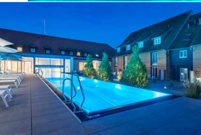
Das Schwimmbecken ist unter anderem mit LED-RGB-Scheinwerfern ausgestattet, die das Wasser des Pools bei Einbruch der Dunkelheit in ein Lichtermeer hüllen.