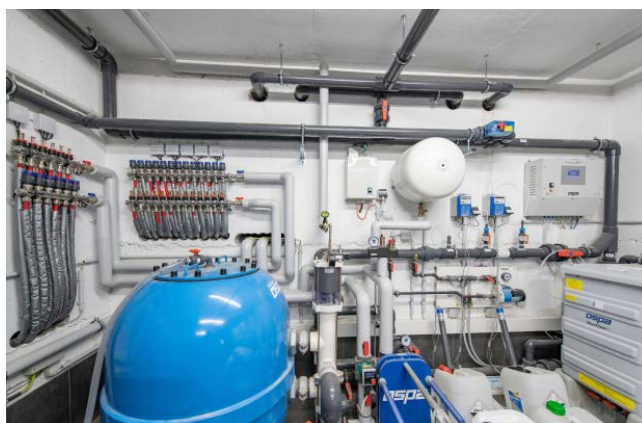
Die Ospa-Technik ist unterm Becken in einem Technikraum installiert.