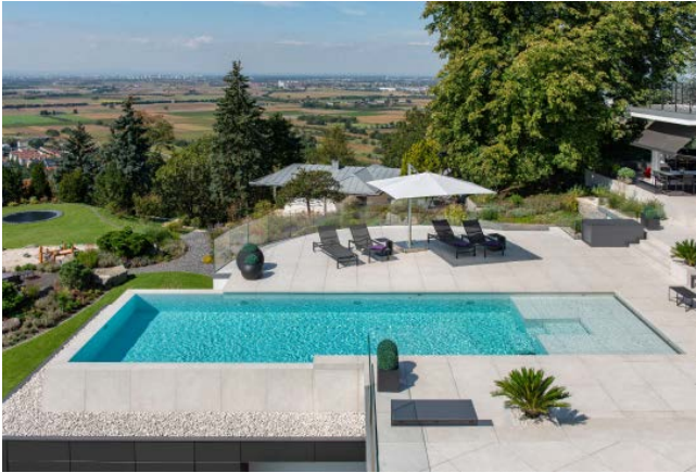
Etwa zur Hälfte umschließt eine große Terrasse das Schwimmbecken.